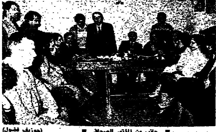
جانب من المؤتمر الصحافي...